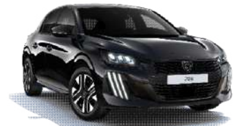
Negro Perla Nera