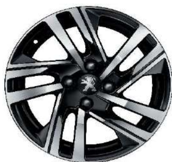
SOHO 16" Allure Pack