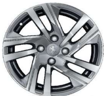
TAKSIM 16" Active Pack