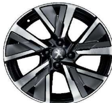
CAMDEN 17" GT