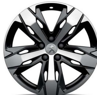
LOS ANGELES 18" Allure Pack /GT