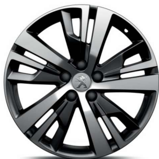
DETROIT 18" Active Pack