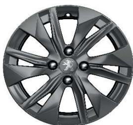
ELBORN 16" Active Pack