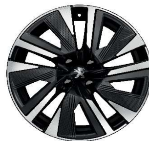
BUND 18" GT