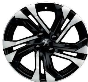
SALAMANCA 17" Allure Pack